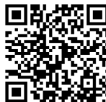
แบบแสดงเจตนาเข้ารับการสรรหา